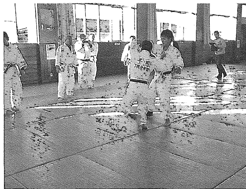
写真2 福島県南相馬市での指導